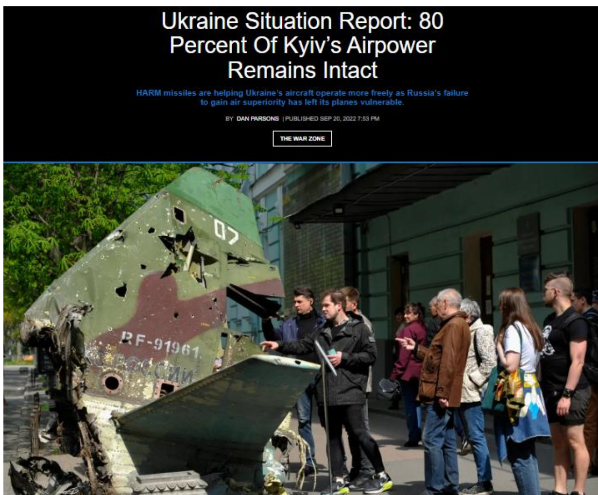
Ucrânia mantém intacto 80% de seu poder aéreo

- O site “CAVOK” noticiou que a Ucrânia teria abatido quatro aeronaves russas, 01 Su-25, 02 Su-30 e 01 Su-34. Segundo a matéria, a Força Aérea russa participou pouco dos últimos dias de conflito, chegando a ser notório que as investidas ucranianas contavam com apoio aéreo, enquanto as russas não dispunham de tal apoio. A razão para essa discreta participação da Força Aérea russa seria a maciça e eficiente presença da DAAe ucraniana. Tal publicação possui relevância, pois demonstra não apenas que a DAAe deve estar planejada e desdobrada de forma a neutralizar ameaças aéreas, como também reforça a dissuasão ocasionada pela presença de uma DAAe, culminando com a interferência no planejamento de incursões por parte do inimigo, ocasionando a redução de surtidas aéreas diante do risco de perder as aeronaves envolvidas em tais ações.