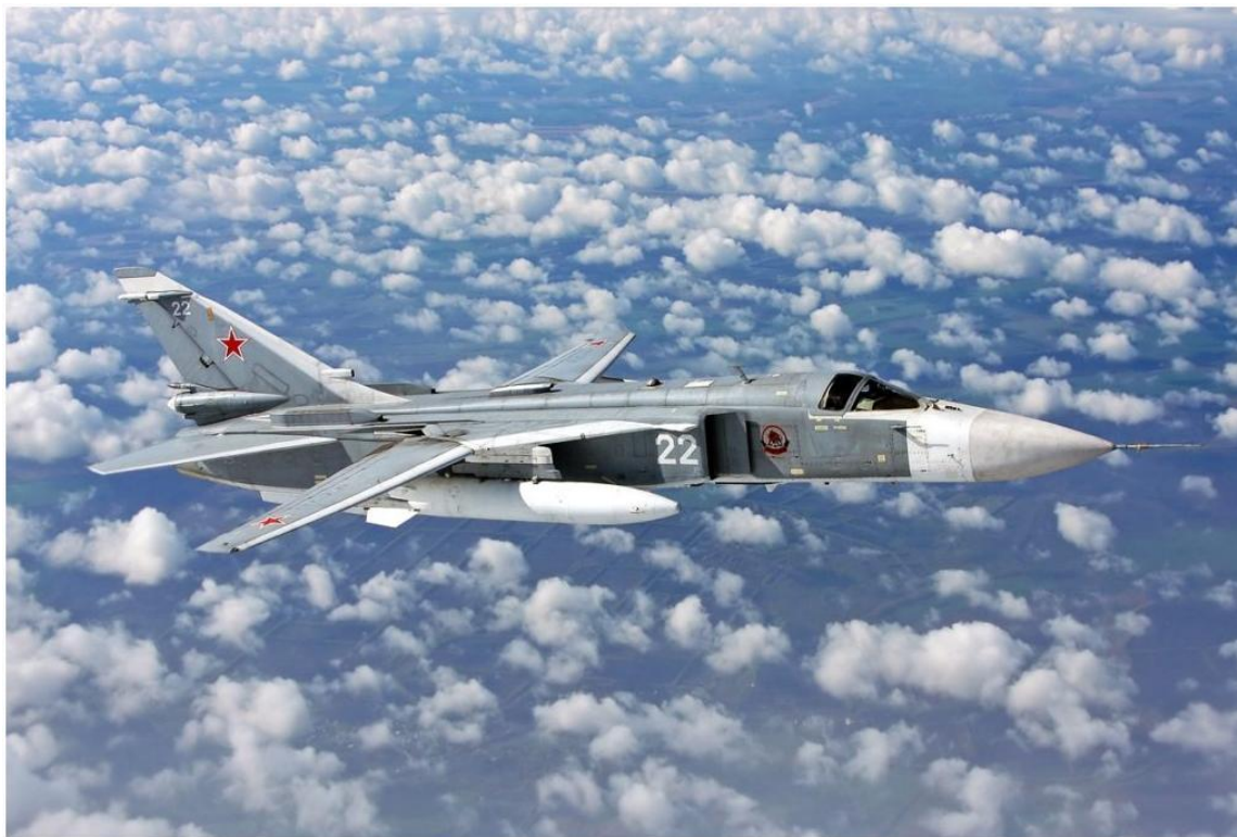
Su-24 e Su-25 russos são abatidos por SAMs ucranianos. Na foto um Su-24 russo (Foto: Sukhoi).

https://forcaarea.com.br/su-24-e-su-25-russos-sao-abatidos-por-sams-ucranianos/