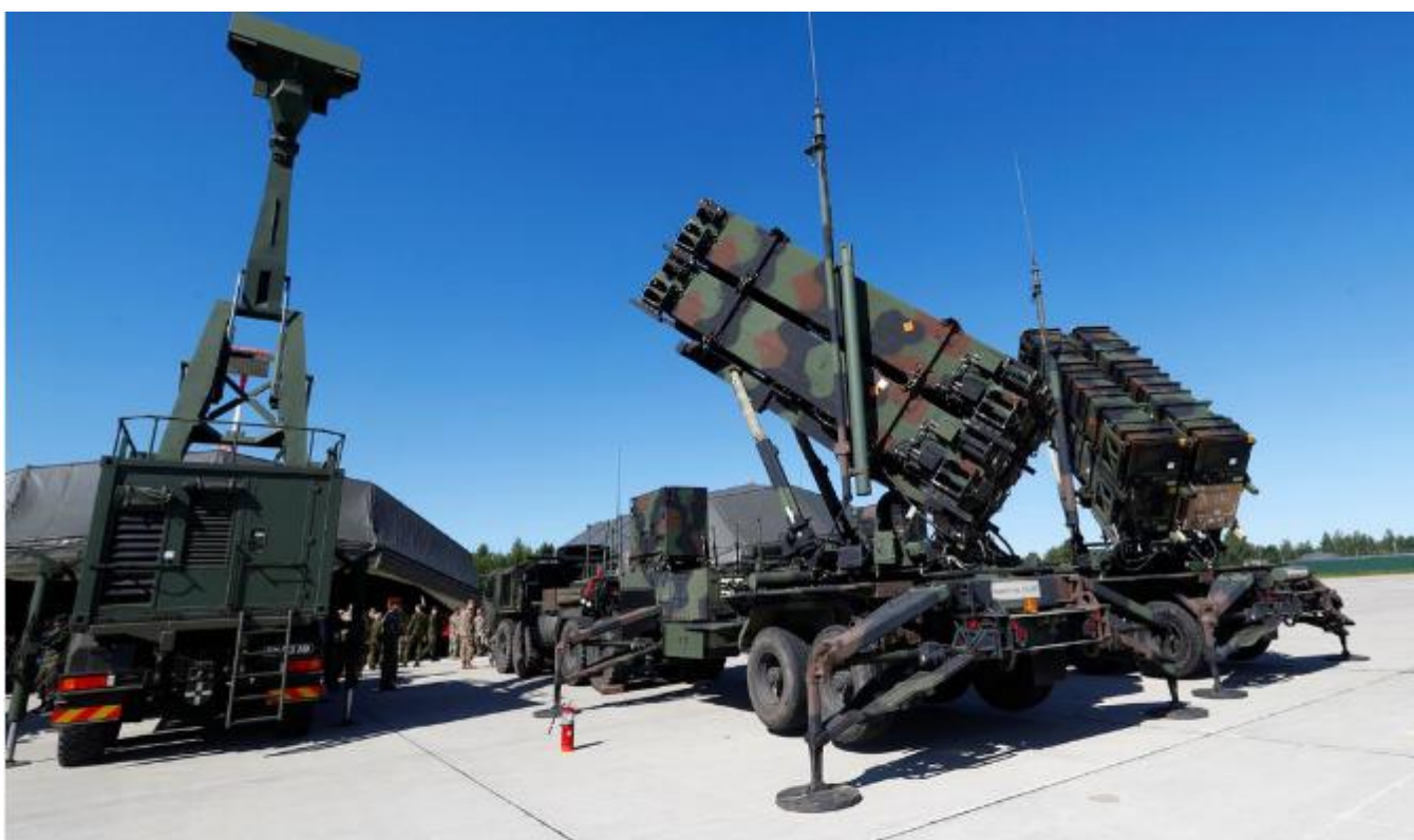
U.S. long range air defence systems Patriot (R) and British radar Giraffe AMB are displayed during Tobura

https://twitter.com/mod_russia/status/1505374819839356932?s=20&t=CxIJauprJG4cUxqn3QxCPg