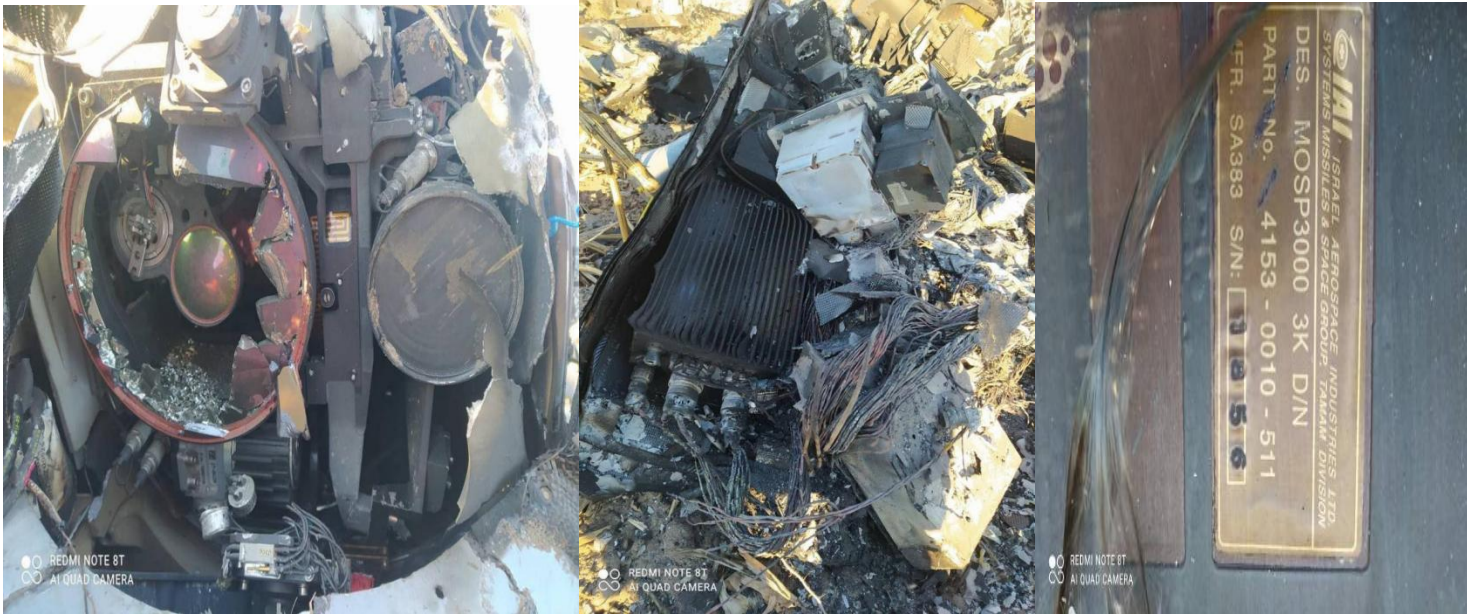
Ministério da Defesa da Ucrânia divulga abate de drone russo Forpost-R.

Our Bureau 08:06 AM, March 16, 2022 3582