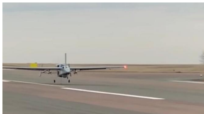
Drone armado russo Forpost-R