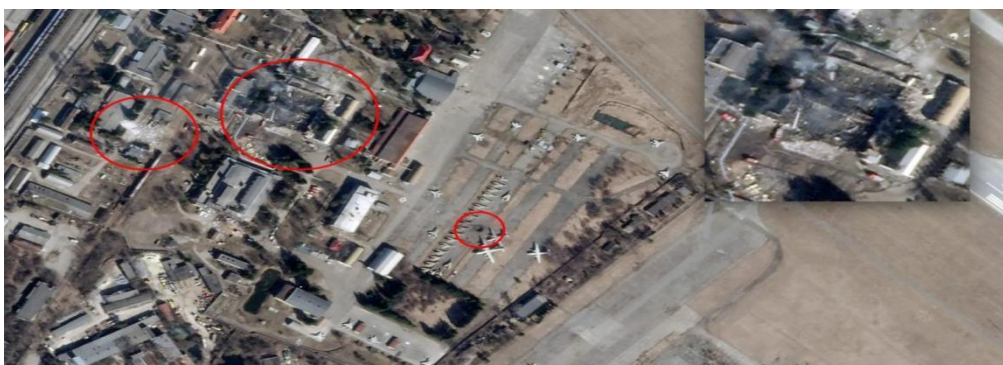
Mísseis russos atingem instalação de reparo de aeronaves ucraniana.