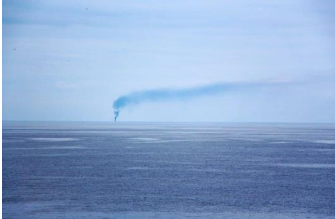
Corveta Russa é atingida por foguetes Ucranianos

https://www.naval.com.br/blog/2022/03/07/navio-de-patrolha-russo-vasily-bykov-e-atingido-por-artilharia-ucraniana/