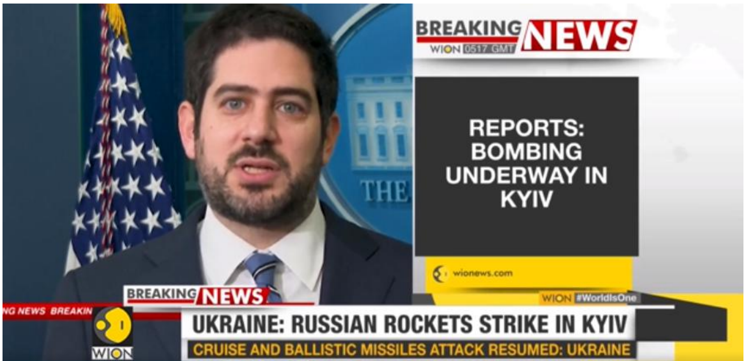
Massivo ataque de mísseis balísticos e de cruzeiro em Kiev