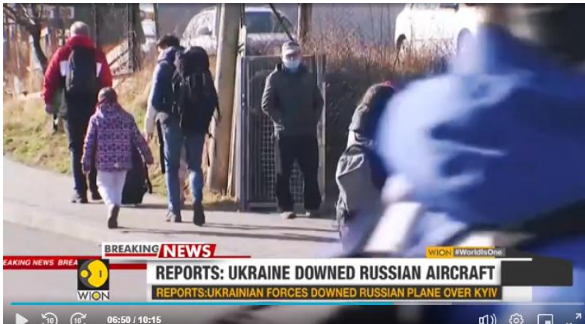
Derrubada de uma aeronave de caça da Rússia

https://www.wionews.com/videos/russia-ukraine-conflict-3-civilian-areas-of-kyiv-report-massive-missile-strikes-456315